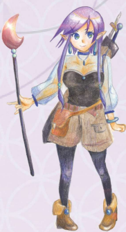
アイエムアイ公式キャラクター なるみ あい 成実 愛

“人と人をつなぐ媒介”、“中間物”という意味で の「intermediate」から「imi」と命名いたしました。